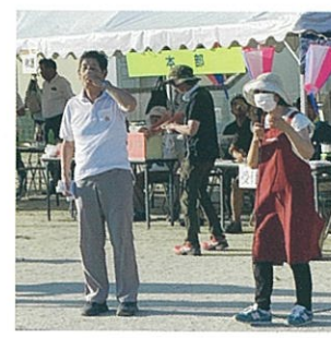
会長・副会長の開催宣言

また日立風流物西町支部 の『子ども鳴物』をスター トさせその躍動感ある演奏 に聞きいりました。全員で ビンゴゲームを楽しみまし た。その後模擬店での販売 も開始され大勢の参加者で にぎわいました。久しぶり の盆踊りのあとはお楽しみ 抽選会で締めくくりました。