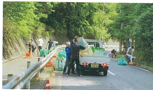
通学路清掃作業の様子