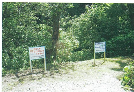
一の鳥での清掃作業の様子

日(日)に行いました。 昨年度に設置した不法投 棄禁止看板の効果により一 の鳥の駐車スペースには不 法投棄はありませんでした。 今回は、実施予定日(土 曜日)が雨のため日曜日に 順延しましたが参加人員が 少なかったため次回に期待 します。