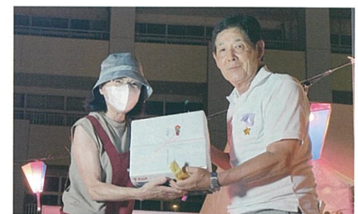
お楽しみ抽選会で1等賞当選者