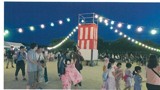
提灯でてらされた盆踊り会場