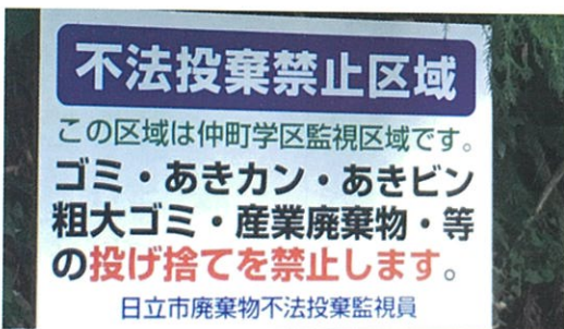
新しく設置された看板

日(日)に行いました。 昨年度に設置した不法投 棄禁止看板の効果により一 の鳥の駐車スペースには不 法投棄はありませんでした。 今回は、実施予定日(土 曜日)が雨のため日曜日に 順延しましたが参加人員が 少なかったため次回に期待 します。