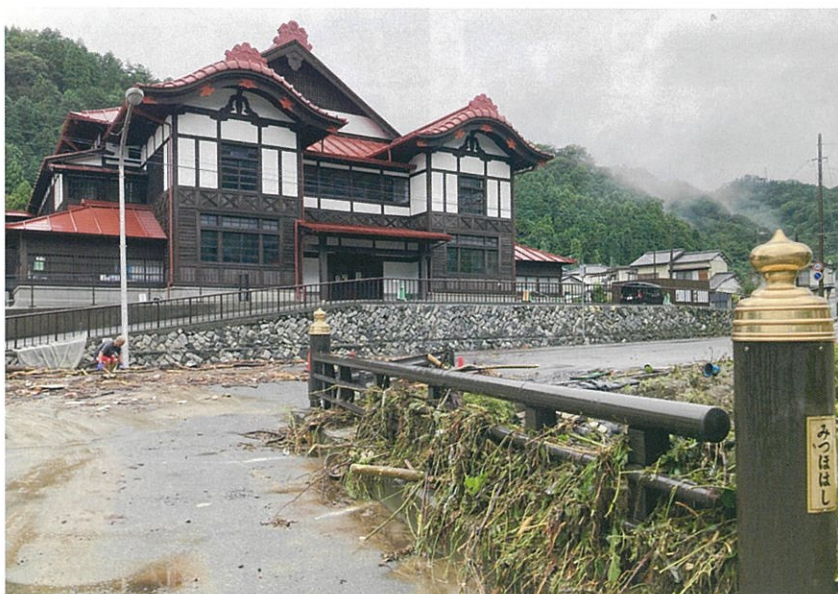
宮田川氾濫でみずほ橋欄干にたまった流木 奥は日立武道館(旧共楽館) 9月9日朝6時45分撮影

宮田川は1947年9月のカスリーン台風の大氾濫したという記録が残っています。このときの24時間降水量は171ミでした。宮田川は大雨のときには氾濫する可能性があることに配慮して、今後の防災対策を考える必要があります。