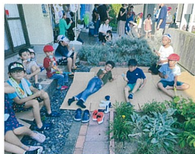
楽しかった『わんぱく隊2023』