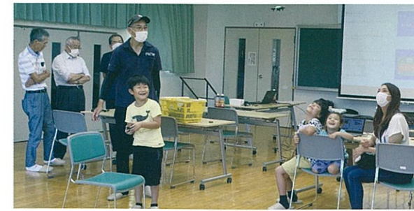
ドローンの疑似体験